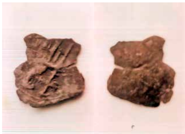
Сл. 8 Монета на Андроник II Палеолог (1282-1311)

над два метра и во сите делови продолжуваат кон т.н “микростанбена целина” 39 . Висината на градбите од камен и кал докажува дека се од траен карактер – луѓето кои ги користеле трајно биле населени на денешниот локалитет (прилепени се пет сида до “т.н театарскиот плоштад” градени од камен и кал до “реставрираната градба како дел од театарот”). Тие градби од камен и кал се последната фаза на градби во античкиот град и се наоѓаат над ранохристијанските градби. Но кај нас сè уште не се подготвени да ги препознаат. Сите истражувања во Македонија се свртени кон Рим и раното христијанството, таму има наоди и простор за обработување. Најмногу во Европа е пишувано за нив: Рим и ранохристијанството, постои огромна литература од која можат да се црпат размислувања. Словенското 40 средновековие на балканските простори е сведено само на некој ако начека некропола и тука нешто да објавува. Затоа, на почетокот на текстов, пишувам за архитектурата. Неа во провинцијата на источното Римско царство, средниот век ја означуваат “варварите” - Словени. Не значи дека ако нема средновековни движни наоди, градбите не се словенски. Напротив, по тоа ги препознаваме, градбите од камен и кал во македонските села се градеа до шеесетите години на минатиот век. “Македонија била средиште од кое византиската култура и политичкото влијание се ширеле и на соседните јужнословенски земји.” 41 Ми остави впечаток и една констатација во нивниот текст, имено: “Според стручната обработка на движните наоди и нивното