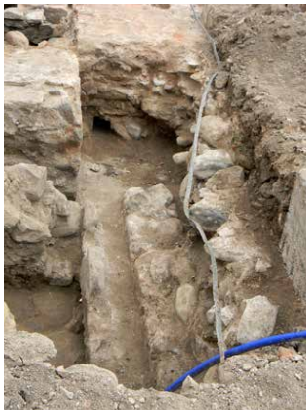
Сл.10 Сид исток - запад во Старата Чаршија со канал за дренажа.

вените го населуваат античкиот град Хераклјеа Линкестис. А во преостанатиот втор слој (презентирани од Томашевиќ) 46 е средновековието кое води се до XIV век. Спрема она што го исфрлија од земјата при ископувањето на горните слоеви (хумусот) забележав и темнозелена, со глед-маса турска ќерамика. Ранохристијанската базилика Е има архитектонски елементи и од средниот век, не е дилема дали постоела и во XIII и XIV век. Но несомнено, оваа градба докажува дека средновековна Битола е над античкиот град Хераклеја Линкестис.