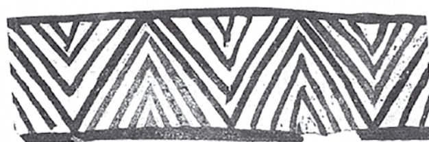
Сл.4 Св. Илија, Долгаец