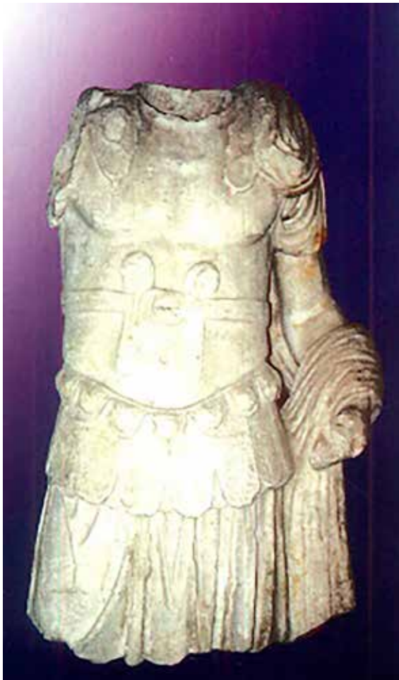
Сл. 7 Оклопник

то, заклучокот е: првата апсида е на западната (ранохристијанска) црква, а втората е на источната (средновековна) црква, заедно со северниот ѕид и североисточниот дел на ѕидот од левиот дел на апсидата, како и северозападниот дел од нартексот - левиот дел од влезната врата. И логично е зошто е сочуван северниот и деловите на северозападниот ѕид и североисточниот - оти биле понови, не е правило, но може да се прифати. Зависи од девастацијата од каков тип е, дали е останата црквата да се урива од времето, сама од себе, или намерно е уништувана. И на крајот, градењето на базилика половина со камен и варов малтер, половина со камен и кал, не е во духот на римската, градска ранохристијанска традиција. Црквата во ранохристијанскиот период е монументална градба која треба да истакне верба во напредок. Во овој текст предлагам и една поправка 29 на една фотографија и текст во кој стои: “На запад се наоѓа Екседра (полукружен простор (сл 39) во кој најверојатно стоеле статуи, во нашиот случај изгледа дека била статуата - оклопник, секундарно употребена како камен темелник на понов објект