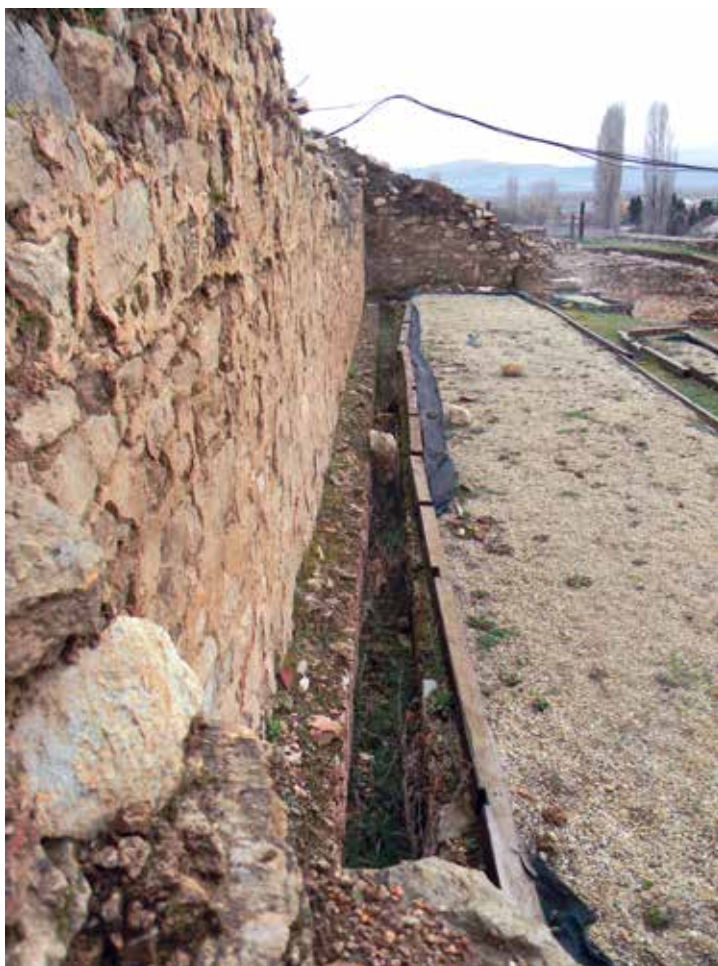
Сл.6 Северниот ѕид со канал кој се протега низ северниот брод

скиот, а прифатен е грчкиот јазик во Константинопол. Во годината 634. Арапите ја заземаат Сирија, со неа и Блискиот Исток и територии во Африка. 28 Во текот на VII век, источното Римско царство постепено го губи римскиот карактер. Поточно, трансформацијата настанува во 640 г. најпрво со црквата, а потоа во сите социјални дејности на државата. Варварите – Германи во V век го заземаат Рим и тие веќе се пониска класа за народот од источното Римско царство. Овај аргумент ни кажува дека веќе нема дијалог – не се разбираат. Два патријарси во две различни држави – еден е во Рим, другиот во Цариград. Во 1054 година доаѓа делегација од западниот патријарх, и среде служба во св.Софија во Цариград го ескомуницира источниот патријарх, што овој во истиот момент му врати со иста мера. Оттука заклучуваме дека во прашање е политика, а претходно се поделени сферите на интерес. Од ова изложено-