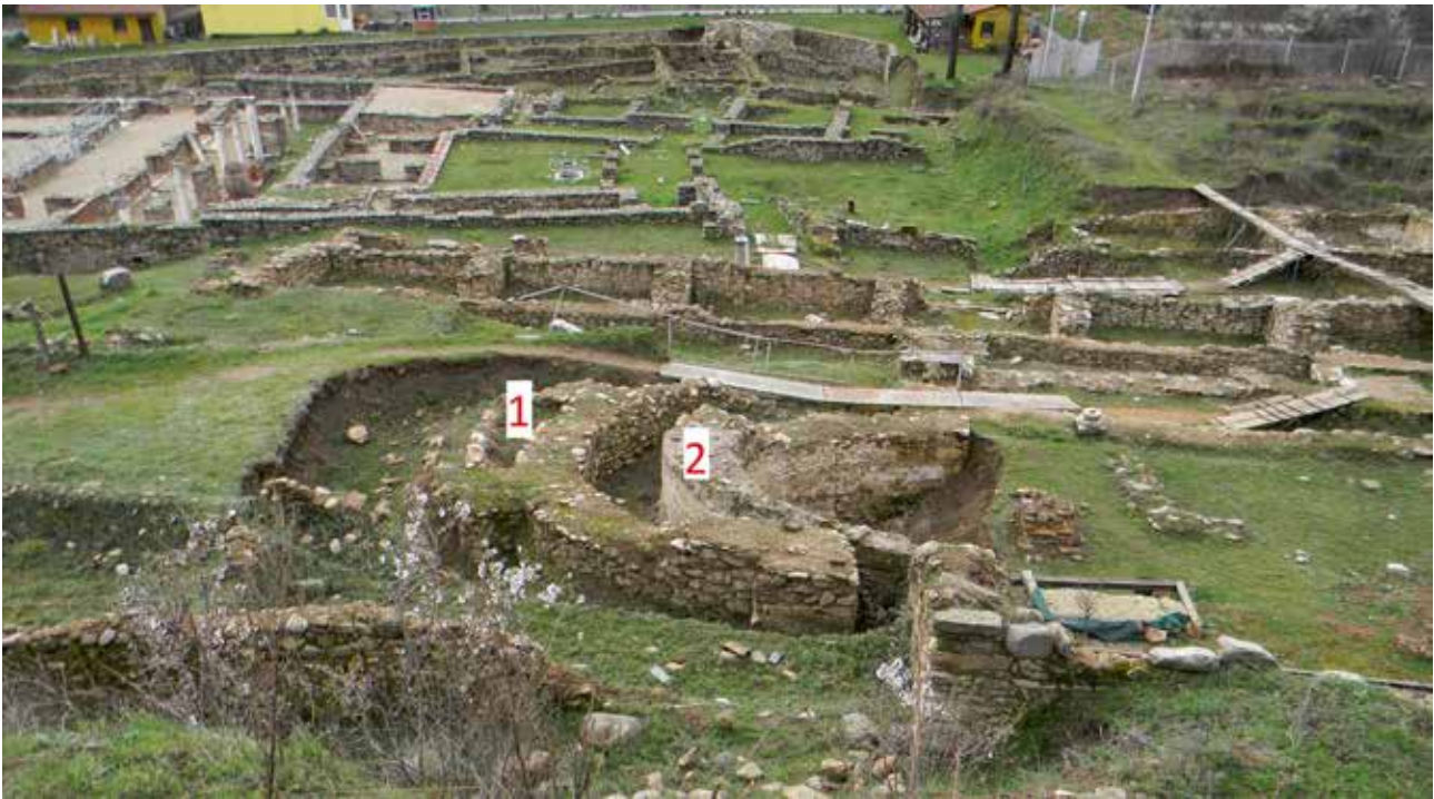
Сл. 1. Две апсиди, првата ранохристијанска, втората средновековна со аналојот

немаш документација немаш вистина.“ Сите мои заклучоци кои следат се по пат на опсервација, логика и лична проценка. Во овој случај, јас користам неинвазивна археологија за истражување, само ги следам археолошките записи. Се надевам дека со овој мој приод кон проблемот ќе успеам да прикажам аргументи и факти кои се потребни за мојата теза. Оваа црква или базилика 8 која е именувана како “Базилика Е“ се наоѓа во античкиот град Heraclea Lincestis и тоа северозападно од комплексот “Театар” и северно од “т.н. Епископска резиденција.“ Црквата е на тој дел од ридот со ориентација запад исток, а за мене се најинтересни архитектонските делови на северниот ѕид со дел од северозападниот нартекс и североисточниот ѕид со втората источна апсида. Според моите мерења, северниот ѕид е долг 23 м. и 40 см. Источниот ѕид е широк 15 м. и 37 см. Вкупната должина на црквата со апсидата е 27 м.