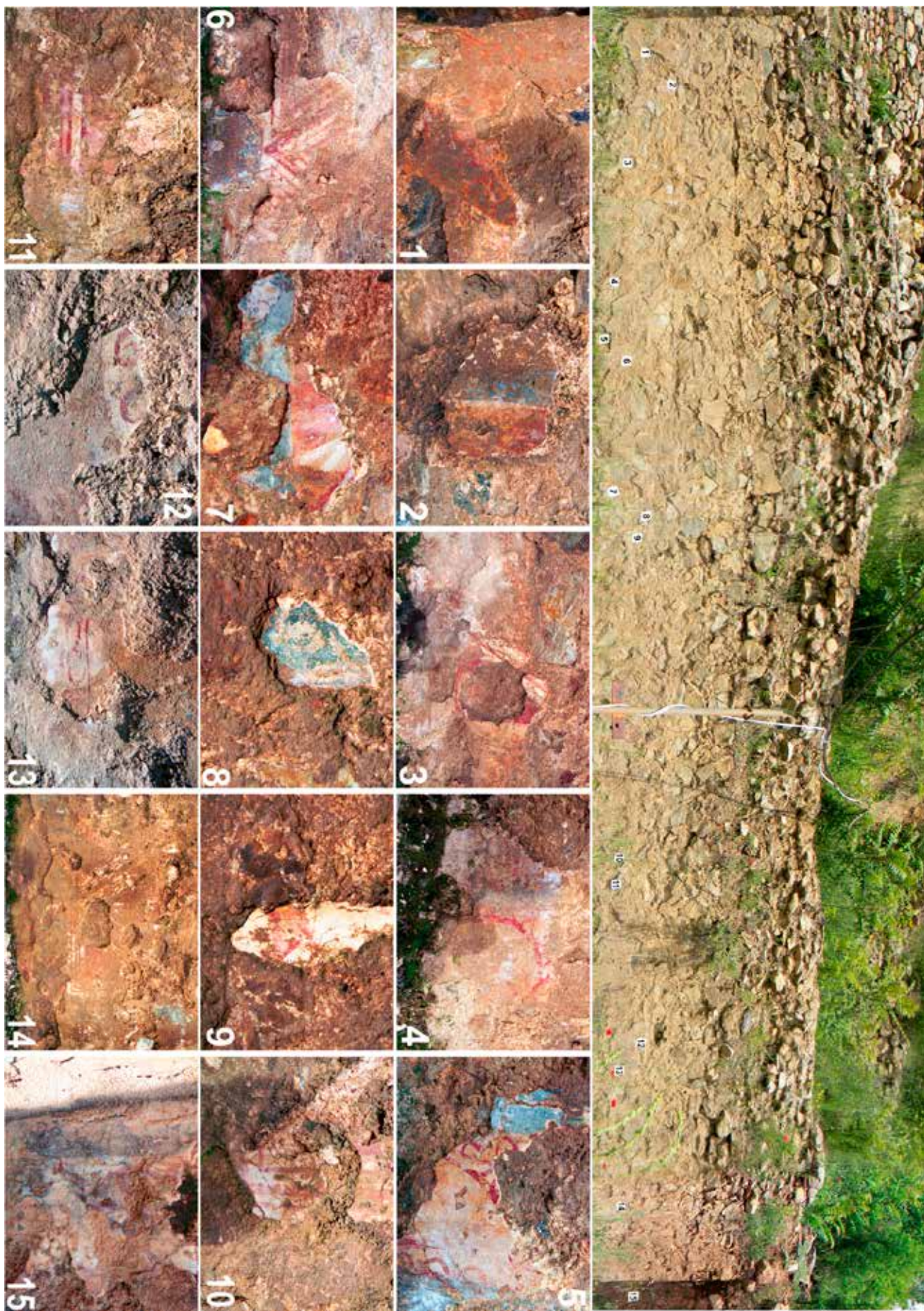
Сл. 2. Северен ѕид со фрагменти на орнаменти од фрески